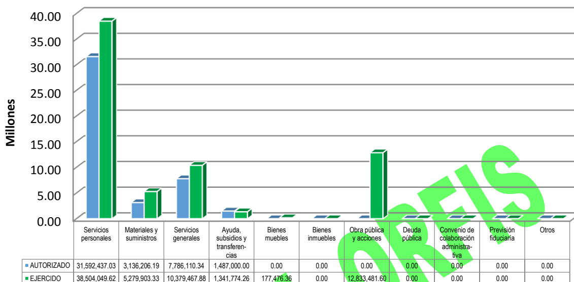
GRÁFICA 2 EGRESOS